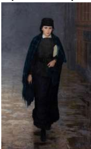
5 Николай Ярошенко. Курсистка

Замечательным вкладом Ярошенко в русскую живопись стал цикл картин, посвященный передовой русской молодежи, различному революционному студенчеству. Ярошенковская "Курсистка", юная, обаятельная, стала не меньшим откровением, чем картины "Кочегар" и "Заключенный".