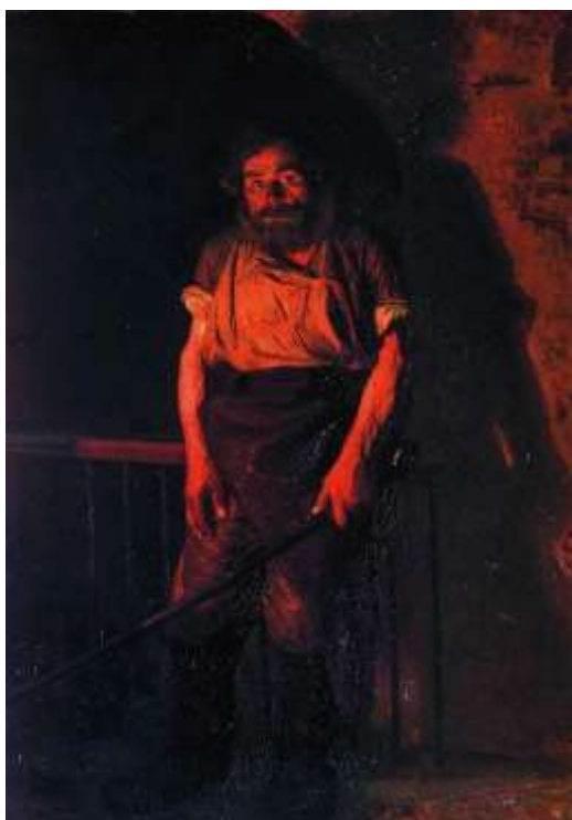
3 «Кочегар», 1878

времени, символами эпохи реформ императора Александра II стали картины "Кочегар" и "Заключенный", представленные на выставке передвижников.