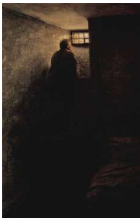
4 «Заключённый», Николай Александрович Ярошенко

Замечательным вкладом Ярошенко в русскую живопись стал цикл картин, посвященный передовой русской молодежи, различному революционному студенчеству. Ярошенковская "Курсистка", юная, обаятельная, стала не меньшим откровением, чем картины "Кочегар" и "Заключенный".