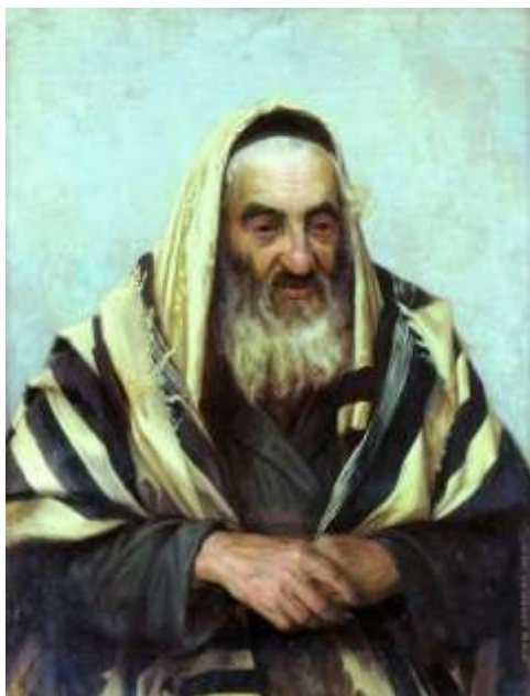
2 Старый еврей. 1896 г.

этому же периоду относится и первое посещение Кисловодска молодыми супругами.